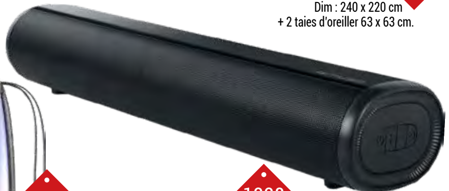
1328 BARRE DE SON Bluetooth, puissance 80W, indicateur LED, port USB, support mural, entrée auxiliaire et entrée HDMI.