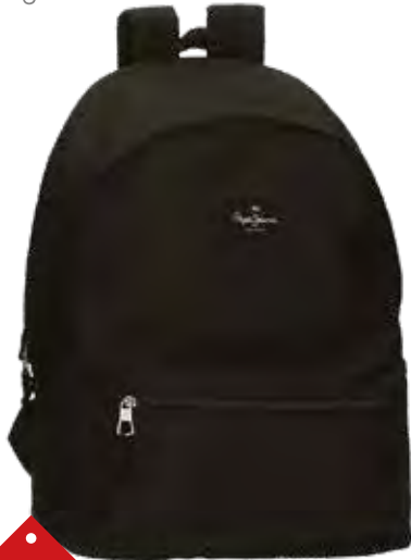
1174 SAC A DOS NOIR Dim : 31 x 44 x 17,5 cm.