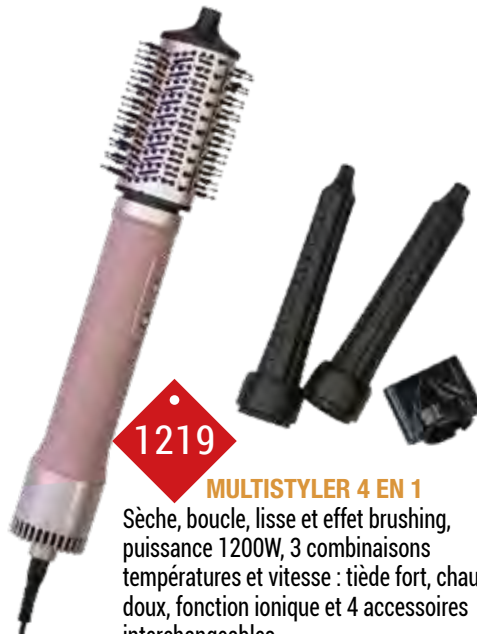
1219 MULTISTYLER 4 EN 1 Sèche, boucle, lisse et effet brushing, puissance 1200W, 3 combinaisons températures et vitesse : tiède fort, chaud doux, fonction ionique et 4 accessoires interchangeables.