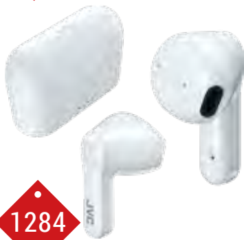
1284 ECOUTEURS JVC BLANC Bluetooth 5.1, microphone mains libres et compatible assistant vocal, imperméable à la pluie (IPX4), autonomie 22h avec la batterie intégrée et le boîtier de charge. Charge rapide.