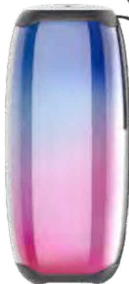
1302 ENCEINTE PORTABLE LED Bluetooth 5.1, waterproof, puissance de 20W, système TWS, radio FM, autonomie 4 à 5h selon utilisation. L'enceinte LED s'illuminera au rythme de la musique.