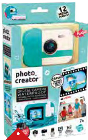
1349 APPAREIL PHOTO WATERPROOF

Parfait pour prendre des photos et vidéos sous l'eau jusqu'à 3m de profondeur. Une carte SD de 16Go est incluse.