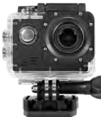
CAMERA DE SPORT 4K Résolution ultra HD 4k, boîtier étanche jusqu'à 30m, commande à distance via smartphones et tablettes compatibles ios et Android.

Parfait pour prendre des photos et vidéos sous l'eau jusqu'à 3m de profondeur. Une carte SD de 16Go est incluse.