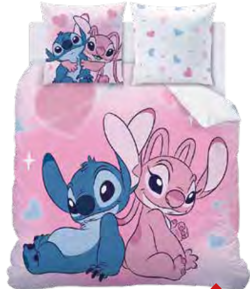
PARURE HOUSSE COUETTE 2 PLACES STITCH BISOUS 100% coton. Réversible. Dim : 240 x 220 cm + 2 taies d'oreiller 63 x 63 cm.