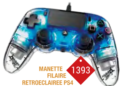
MANETTE FILAIRE RETROECLAIREE PS4 La coque transparente et les LED rétroéclairées font briller la manette dans le noir, 2 moteurs de vibration, prise casque 35mm, longueur 3m.